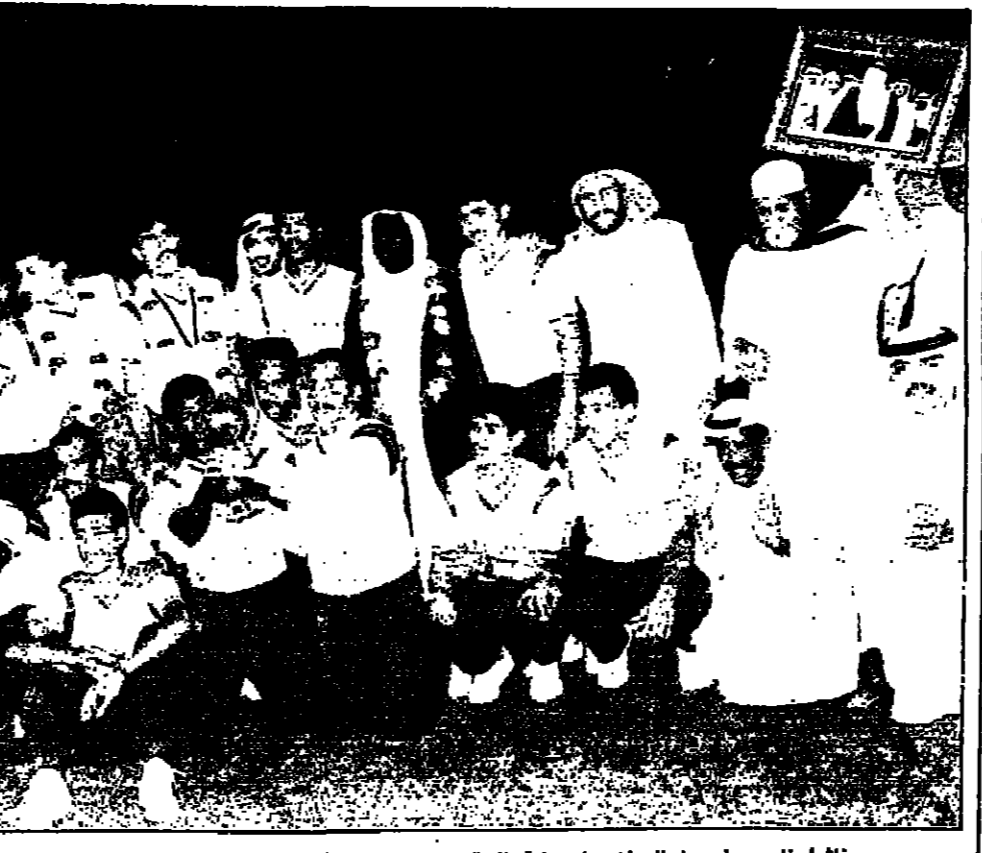
تلتفتونا .. وضعوا الوطن على هامه العلم .. وجاءوا بكاس العلم الى قلب الوطن